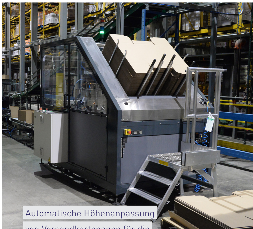
Automatische Höhenanpassung von Versandkartonagen für die Auftragskommissionierung